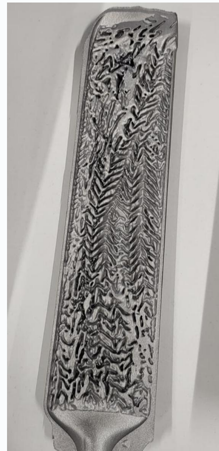
sezione del circuito di raffreddamento ad acqua post ottimizzazione termo-fluido- dinamica