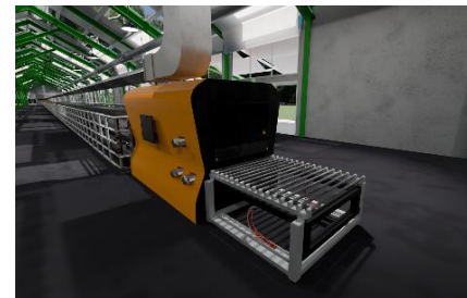
Forno industriale da 160mt di lunghezza

Le aziende addestrano nuovi assunti in VR, migliorando competenze senza rischi o interruzioni nella produttività.