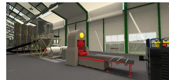
Silos, mulino e pressa