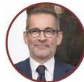
Gian Paolo Manzella Sottosegretario al Ministero dello Sviluppo Economico