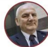
Vincenzo Colla Assessore allo sviluppo economico e green economy, lavoro, formazione della Regione Emilia-Romagna

BI-REX - VIA PAOLO NANNI COSTA, 20 - 40133 BOLOGNA - WWW.BI-REX.IT